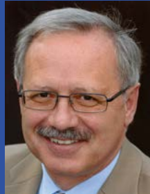
Landrat Hubert Hafner

Der Zweckverband „Interkommunales Gewerbegebiet Landkreis Günzburg“ wurde im Dezember 2009 gegründet. Er hat als eigenständige Körperschaft des öffentlichen Rechts einen großen Teil des ehemaligen Fliegerhorsts Leipheim gekauft und setzt nun die Konversion zum Gewerbegebiet um. Die Mitglieder sind die Gemeinde Bubesheim, die Städte Günzburg und Leipheim sowie der Landkreis Günzburg. Landrat Hubert Hafner ist Verbandsvorsitzender des Zweckverbandes.